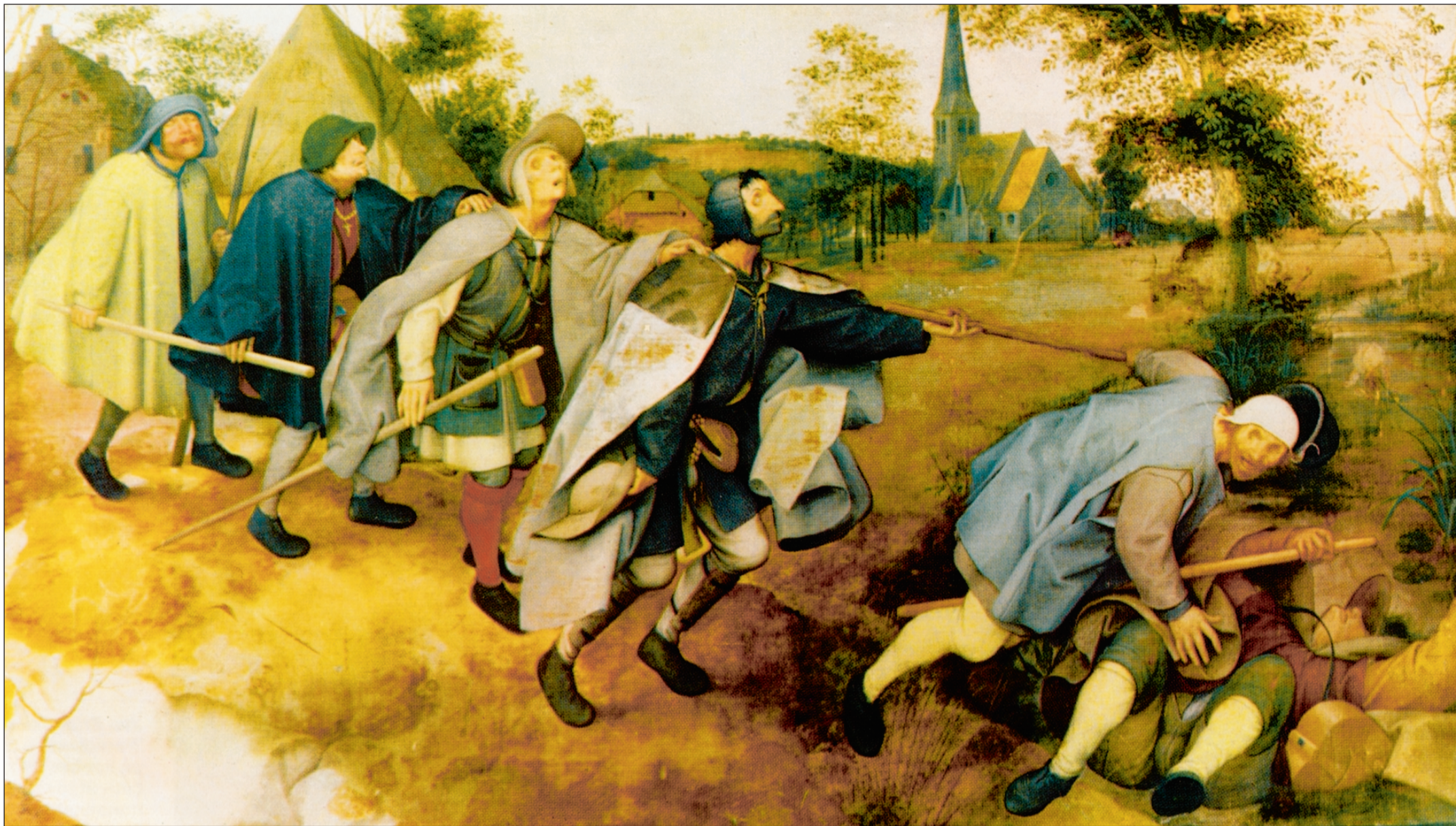
Pieter Bruegel d.æ.: Parabeln om de blinde. 1568. Tempera på lærred. Museo Capodimonte, Napoli.

Jeg ser Ekelöf splittet op i forskellige figurer, ser ham alle vegne i hans tekster. Læst i sammenhæng giver de noget fundamentalt. Men han er nødt til at splitte sig op for at få det lyse og det mørke, begæret og døden og alle de andre