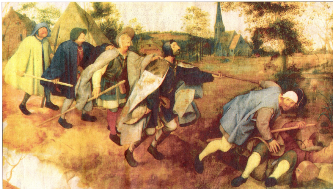
Pieter Bruegel d. a.: Parabeln om de blinde. 1568. Tempera på lærred. Museo Capodimonte, Napoli.

Jeg ser Ekelöf splittet op i forskellige figurer, ser ham alle vegne i hans tekster. Læst i sammenhæng giver de noget fundamentalt. Men han er nødt til at splitte sig op for at få det lyse og det mørke, begæret og døden og alle de andre