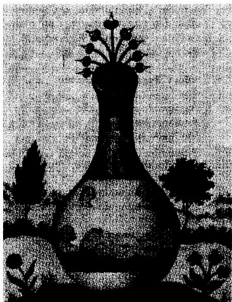
Den Perfekta Lösningen, en alkemistisk bild föreställande manligt och kvinnligt i förening inne i det Filosofiska Ägget, eller degeln, som också är en bild av livmodern

Detta födelse- och återfödelsemotiv tangerar återigen makro-mikrokosmosstrukturen. Makrokosmos är den stora världen — universum och gud —, men samtidigt är människan i sig ett universum (mikrokosmos) skapad och uppbyggd av ett oändligt antal partiklar, äggviteämnen, aminosyror, enkla molekyler, atomer osv "inåt". Människan och tingen utgör en gräns, en tröskel: utåt det oändliga, omslutande och inåt i "virveln" den negativa oändligheten. Vid döden upplöses den här tröskeln eller ytan. I och med upplösningen sammanfaller de båda "oändligheterna", i det totala kretsloppet uppgår de i varandra.