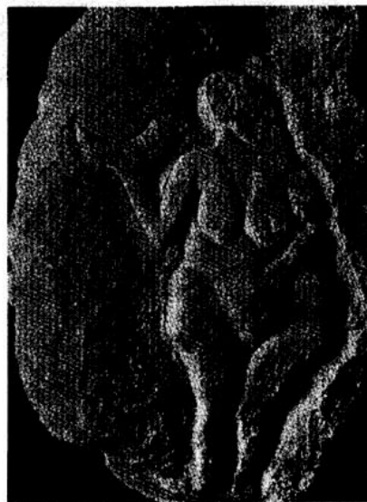
Den Stora Modern, Venus från Laussel

skapen med gudomen/allmodern och detta har skett genom återfödelse i döden. Processen har ägt rum i allmoderns livmoder, varifrån man en gång fötts till denna världen fast i mindre "skala", dvs genom en biologisk moder. Här kan man säga att GE uppfattar födelse och död som en i grunden