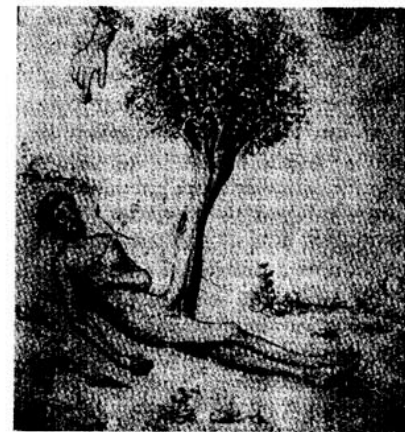
Från döden nytt liv. En annan bild ur den alkemistiska bildvärlden

GE var inte helt opåverkad av den här -ismen, trots protester mot etiketten "surrealist". I "En röst" knyter han i bl a en text an till havet och drömmen, drömmen som ju var ett medel att nå insikt om och kontakt med allmodern.