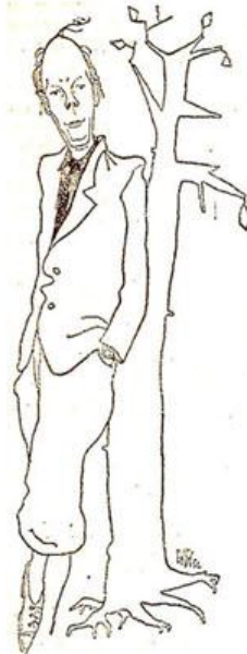
EWK:s bild av Ekelöf.